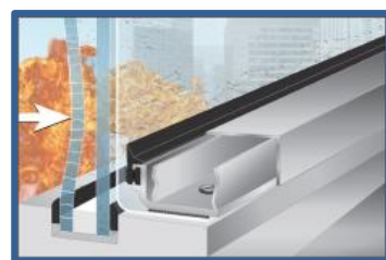
L'onda d'urto dell'esplosione frantuma il vetro esterno con spinta verso il vetro interno.

E. La chiusura superiore opzionale è disponibile in qualsiasi codice RAL, per essere abbinato ai serramenti esistenti.