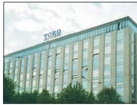
• SEDE TORO ASSICURAZIONI - TORINO