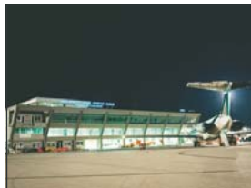
• AEROPORTO - FRIULI VENEZIA GIULIA