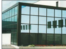
• GRUPPO CREMONINI - MODENA