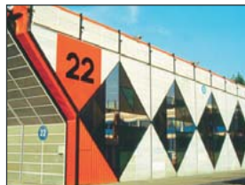
• FIERA DI BOLOGNA