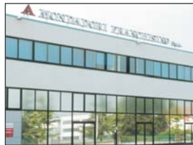
• MONDADORI - VILLA VERUCCHIO - RN